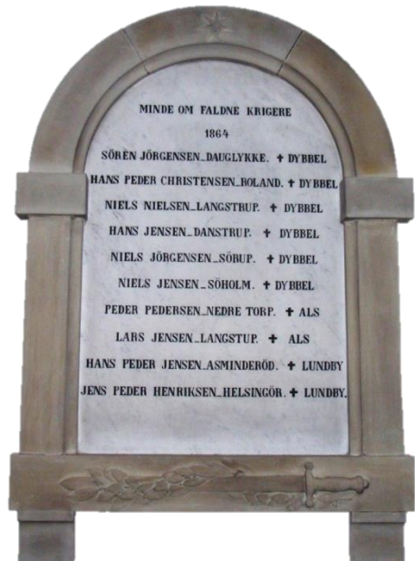
Mindestenen i Asminderød Kirke.